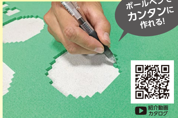
展示品にあわせて自分で簡単に仕切りが作れます!